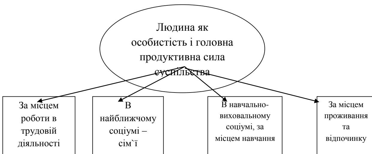
Рис. 1. Сфери самореалізації людини як особистості і головної продуктивної сили суспільства

Але чи замислювалися ми, якою людиною потрібна, в першу чергу, сама собі? Зрозуміло, такою, яка самореалізується, в першу чергу у трудовій діяльності (згадаємо думку українського Сократа Г.Сковороди про те, що людина буде щасливою, якщо знайде «зрідну» працю).