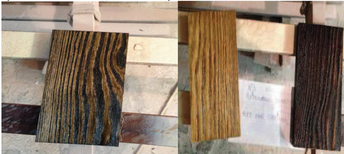
Рис. 1. Брашовані зразки, оздоблені тонованим масло-воском та золотою патиною

Четверта партія – зразок не брашований, покритий патиною та водно-дисперсійним лаком Kompozit. В якості контролю було взято зразки брашованої соснової дошки без покриття.