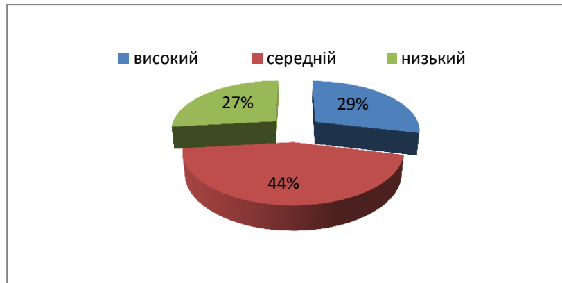
Рисунок 1. Рівні вихованості ціннісного ставлення до с/г праці за мотиваційним критерієм

Рівень вихованості ціннісного ставлення до сільськогосподарської праці у студентів за когнітивним критерієм також було проаналізовано за