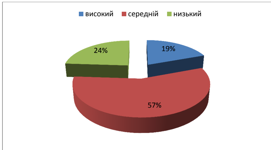
Рисунок 4. Рівні вихованості ціннісного ставлення до сільськогосподарської праці у студентів аграрних ЗВО за поведінковим критерієм

Ретельний аналіз критеріїв та показників дозволяє визначити рівні вихованості ціннісного ставлення до