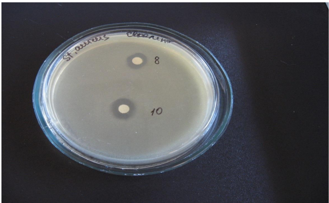
Рис. 2. Діаметр зон затримки росту St. aureus за дії суспензії олії евкаліпту

За силою антибактеріальної дії рослини, що містять ефірні олії розташувались у наступному порядку: чебрець, шавлія, ялиця та евкаліпт.