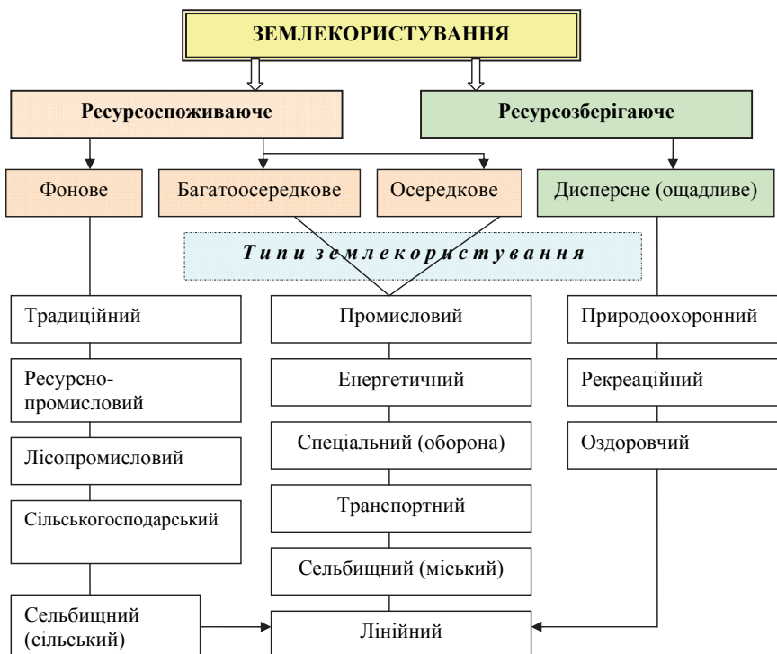
Рисунок 1. Логічно-смысловая модель структури землекористування в Україні

сті, пов'язаній з використанням переважно ґрунтово-біологічних ресурсів. Воно, як правило, максимально адаптоване до місцевих природних умов, і, тим самим вважається основою традиційної культури й способу життя людей. У традиційному природокористуванні вирізняють підтипи, до яких віднесено: а) сільськогосподарське екстенсивне землеробство, екстенсивне тваринництво з використанням природних пасовищ; б) риболовство річкове і морське; в) збирання: заготівля, консервування ягід, грибів, горіхів, харчових і лікарських природних рослин; г) полювання. Ресурсно-промислове землекористування в цілому нагадує за своєю структурою традиційне, однак відрізняється від нього своєю інтенсивніс-