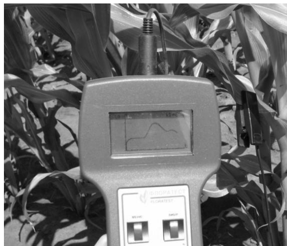
Рис. 1. Зовнішній вигляд портативного флуорометра «Флоратест»

Результати дослідження та аналіз. Характеризуючи процеси фотосинтезу різних сортів томатів, нами зафіксовано, що в сорту «Тарпан F1» активність фотосинтетичного апарату є найбільшою порівняно з іншими (рис. 2). Найменша фотосинтетична активність (ФСА) виявлена в гібриді «Баттлер F1». Істотної різниці між сортами «7500 F1» та «Тарпан F1» не виявлено, хоча перший має дещо нижчий показник.