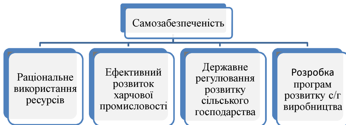
Рис. 1. Основні шляхи формування самозабезпеченості

Значною мірою забезпечення продовольчої безпеки залежить від потенціалу агропродовольчого сектору. Відповідно нормативно-правових актів, потенціал розвитку харчової промисловості є основою забезпечення продовольчої безпеки країни. Аграрний сектор забезпечує продовольчу безпеку та продовольчу незалежність країни, формує 17–18% її валового внутрішнього продукту [5, с. 151].