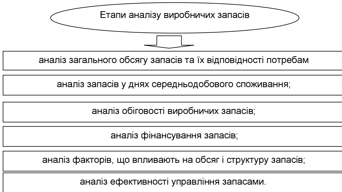
Рис. 1. Етапи аналізу виробничих запасів [7]

Для здійснення оцінки складу, структури і зміни виробничих запасів необхідно використовувати натуральні, якісні та вартісні показники. За їх допомогою оцінюється наявність виробничих запасів, їх склад та рівень забезпеченості ними підприємства, відповідно до реальних потреб та існуючих стандартів, особливості їх формування, руху та ефективності використання.