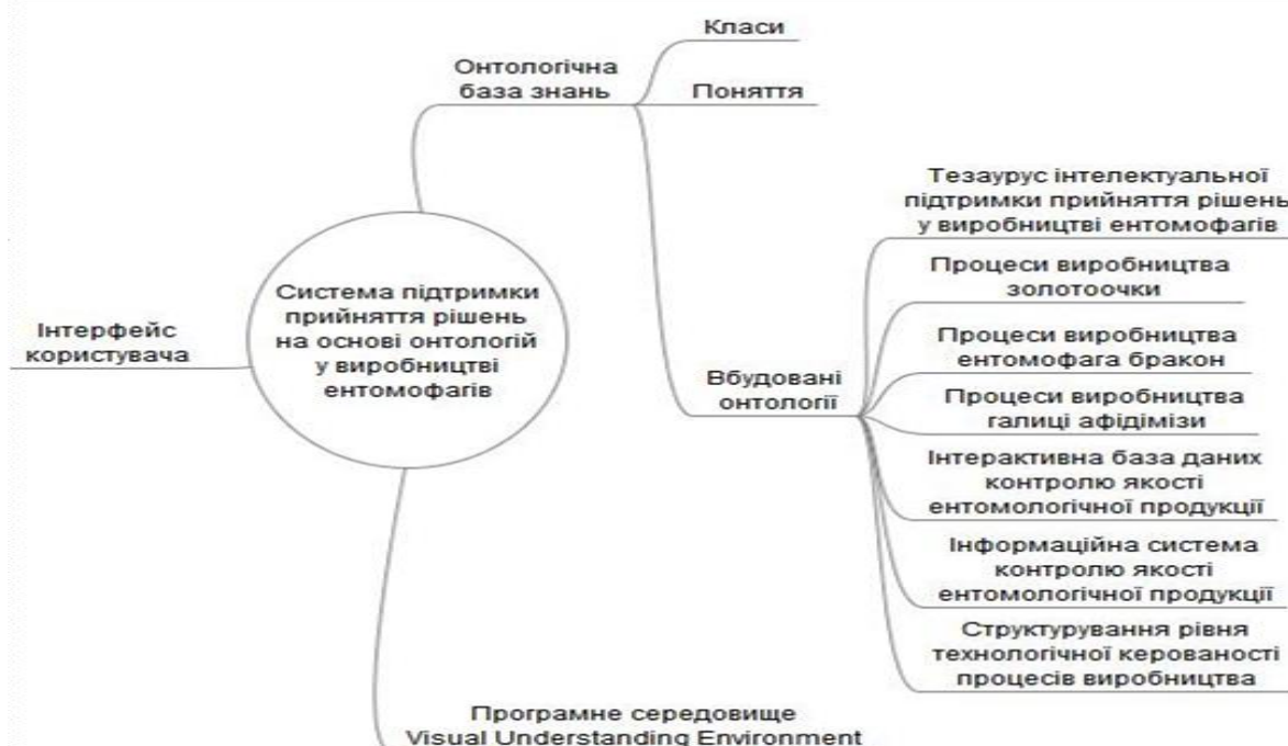
Рис. 1. Асоціативна карта компонентів системи підтримки прийняття рішень

Онтологічна база знань системи підтримки прийняття рішень у виробництві ентомофагів містить: – класи «1.Дії людини у процесах управління виробництвом», «2.Контроль якості ентомологічної продукції», «3.Технологічні процеси», «4.Формалізація знань щодо процесів виробництва», «5.Прецеденти», «6.Підтримка прийняття рішень», «7.Забезпечення якості ентомологічної продукції»; – поняття (1.1. - 1.6.; 4.1. - 4.8.; 6.1. - 6.5.; 7.1. - 7.5.); – вбудовані онтології «2.1.Інтерактивна база даних контролю якості ентомологічної продукції», «2.2.Інформаційна система контролю якості ентомологічної продукції», «3.1.Процеси виробництва золотоочки», «3.2.Процеси виробництва ентомофага бракон», «3.3.Процеси виробництва галиці афідімізи», «5.1.Тезаурус інтелектуальної підтримки прийняття рішень у виробництві ентомофагів», «6.3.1.Структурування рівня технологічної керованості процесів виробництва».