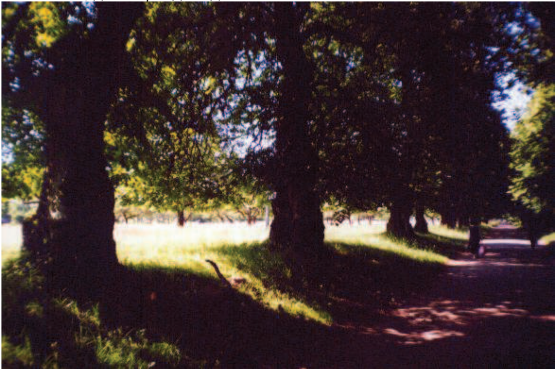
Рис. 3. Липова алея ( T. cordata ), вік близько 400 років. Оброшине, Львівська область

ростуть 163 липи віком близько 400 років. Висота лип коливається в межах 15–25 м, діаметр від 92 до 160 см.