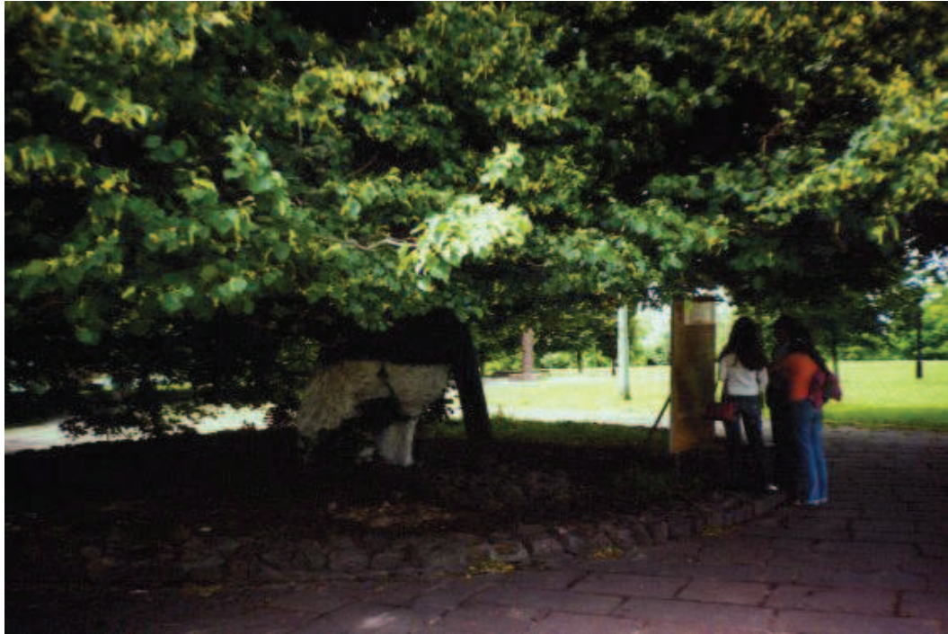
Рис. 2. T. cordata біля Десятинної церкви, м. Київ

Крім уже заповіданих дерев в Україні ростуть ще липи, які за своїм віком і станом необхідно заповісти: