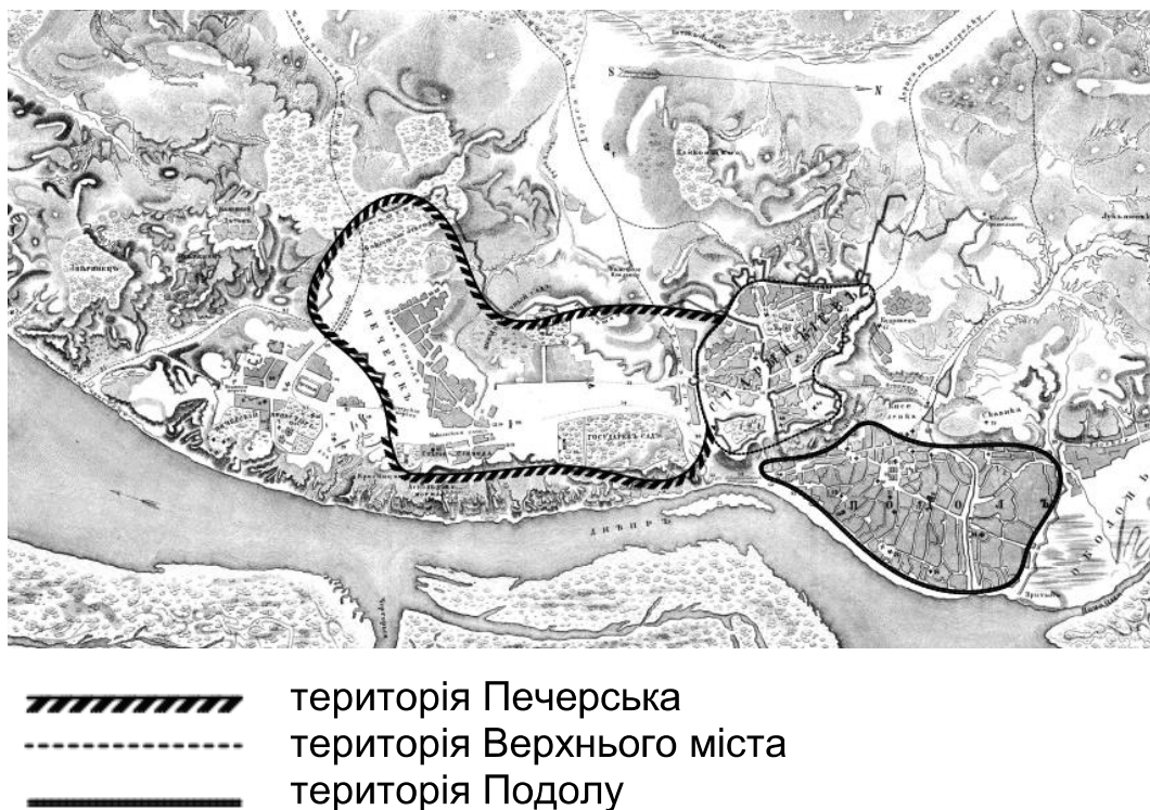
Рис. 1. План м. Києва X ст., за М. Закревським [1]

складалося з топографічно відокремлених історичних поселень (Верхнього міста, Подолу й Печерська) (рис. 1).