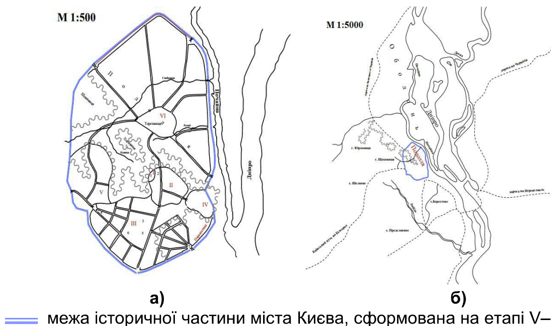
Рис. 2. Плани розвитку містобудівної ситуації м. Києва: а) V–IX ст.; б) IX–XIII ст.

Під час усіх наступних етапів, починаючи з третього (XVII ст.), розробляли певні плани розвитку міста. Проаналізувавши ці плани, можемо дійти висновку про поступове поглинання та зміщення історичного центру Києва (рис. 3).