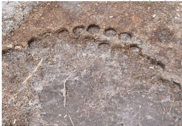
Рис. 2. Відбір зразків підстилки

У кожному типі лісорослинних умов відбирали зразки підстилки – верхнього органічного шару ґрунту (рис. 2), який вносили під сіянець у