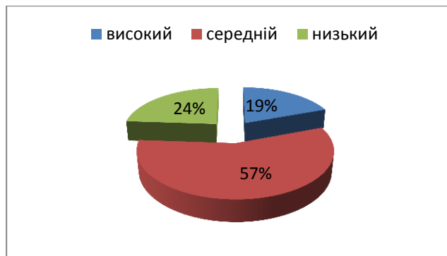
Рисунок 4. Рівні вихованості ціннісного ставлення до сільськогосподарської праці у студентів аграрних ЗВО за поведінковим критерієм

Ретельний аналіз критеріїв та показників дозволяє визначити рівні вихованості ціннісного ставлення до сільськогосподарської праці у студентів аграрних закладів вищої освіти (Таблиця 9).