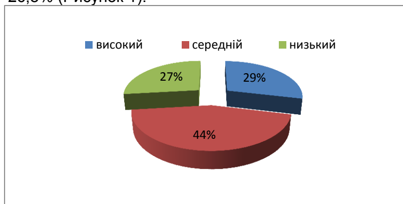
Рисунок 1. Рівні вихованості ціннісного ставлення до с/г праці за мотиваційним критерієм

Аналіз результатів показників свідчить, що у студентів за мотиваційним критерієм недостатньо сформований рівень вихованості ціннісного ставлення до сільськогосподарської праці, адже студентів з високим рівнем – 28,7%, з середнім рівнем – 44,5%, а низьким – 26,8% (Рисунок 1).