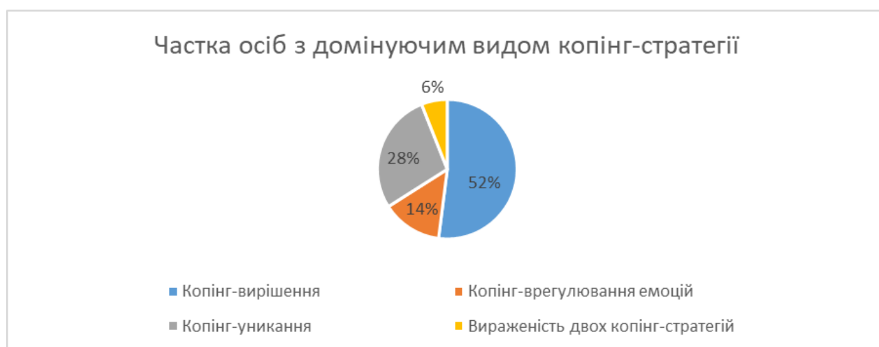
Рис. 1. Узагальнені результати, отримані за допомогою методики «Копінг-поведінка у стресових ситуаціях CISS»

У ході емпіричного дослідження було виявлено домінуючий вид копінгу у студентів (див. рис. 1).