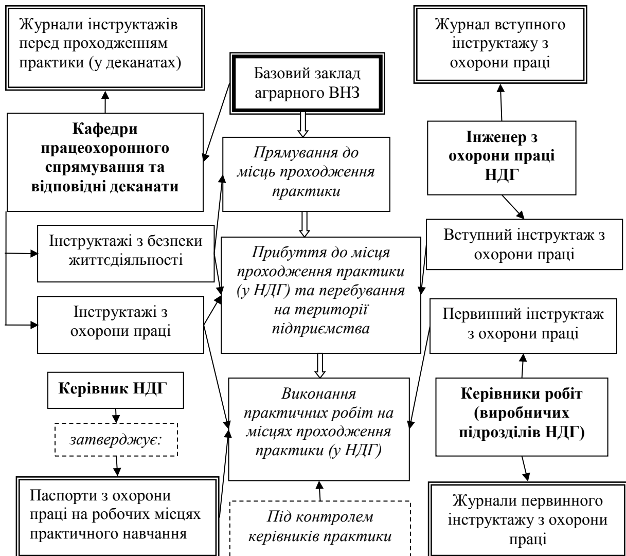
Рис. 1. Порядок проведення інструктажів з охорони праці під час практик студентів аграрних ВНЗ.

За порушення вимог щодо фінансування заходів з охорони праці згідно з вимогами ст. 43 Закону України «Про охорону праці» підприємство має сплатити штраф із розрахунку 25 % від різниці між розрахунковою мінімальною сумою витрат на охорону праці у звітному періоді та фактичною сумою цих витрат за такий період.