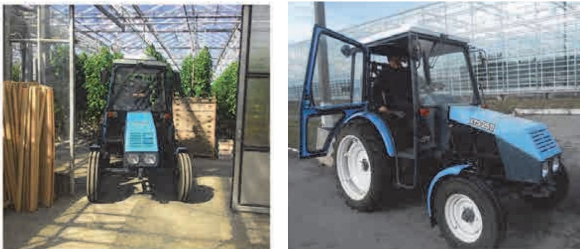
Рис. 1. Відомчі випробування електротрактора у ПАТ «Комбінат «Тепличний»

Проведено попередні відомчі випробування електротрактора у «ПАТ Комбінат Тепличний» (рис. 1) [8].