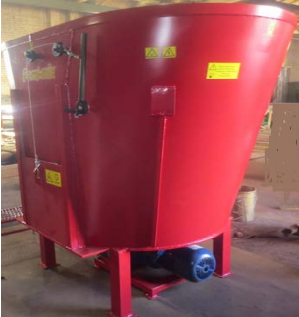
Рис. 1. Стационарний подрібнювач-змішувач.

Огляд різних мобільних кормоприготувальних агрегатів [7, 10, 11] свідчить про те, що для індивідуальних господарств, в яких налічується до 10 голів ВРХ, практично відсутні засоби механізації для приготування повноцінної кормової суміші, яка б відповідала зоотехнічним вимогам.