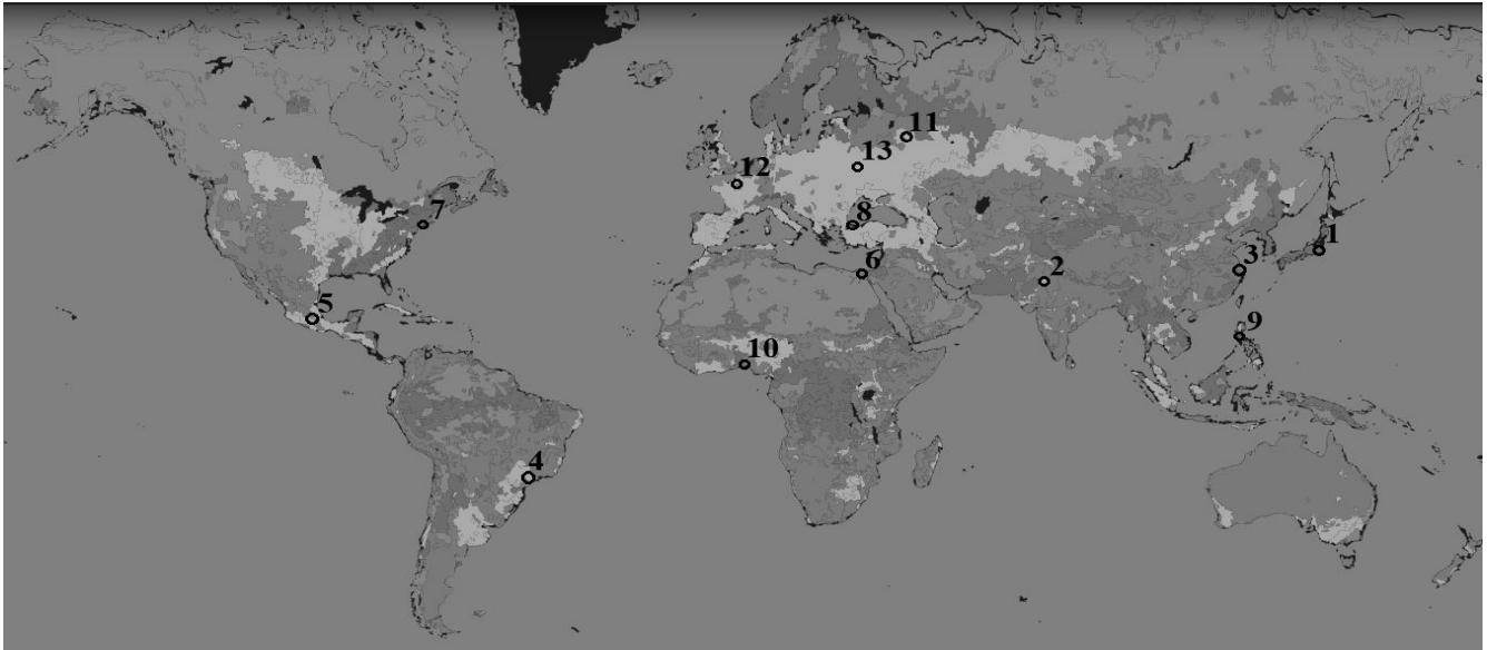
Рис. 1. Карта з міськими центрами для кожного регіону та типом землекористування [1]

На рисунку 1 представлено земле використання наступними групами - білі позначки позначають велику площу сільськогосподарських угідь, світло-сірі - ділянки необроблених земель, темно-сірі – напів-освоєні землі і нейтральні сірі змішанго типу. У контексті дослідження земельні ділянки ідентифікують за видами їх використання для візуалізації і зв'язків між міськими центрами та сусідніми земельними ділянками. Наприклад, у Європі та центральній частині Північної Америки значна кількість земель використовується для сільськогосподарських цілей (сільськогосподарських угідь). Вони служать для забезпечення продовольством густонаселених районів і великих міст регіону. Хоча більшість території Індії та східних районів Китаю густонаселені, але виявилось важко визначити землекористування в цих районах. На рисунку 1 можна побачити, що великі мегаполіси розташовані в основному на території сільськогосподарських угідь або інших земельних ділянках. Дев'ять міст з обарної групи розташовані на узбережжі, що пов'язано з транспортними маршрутами, історичними подіями, а також вигідним географічним розташуванням.