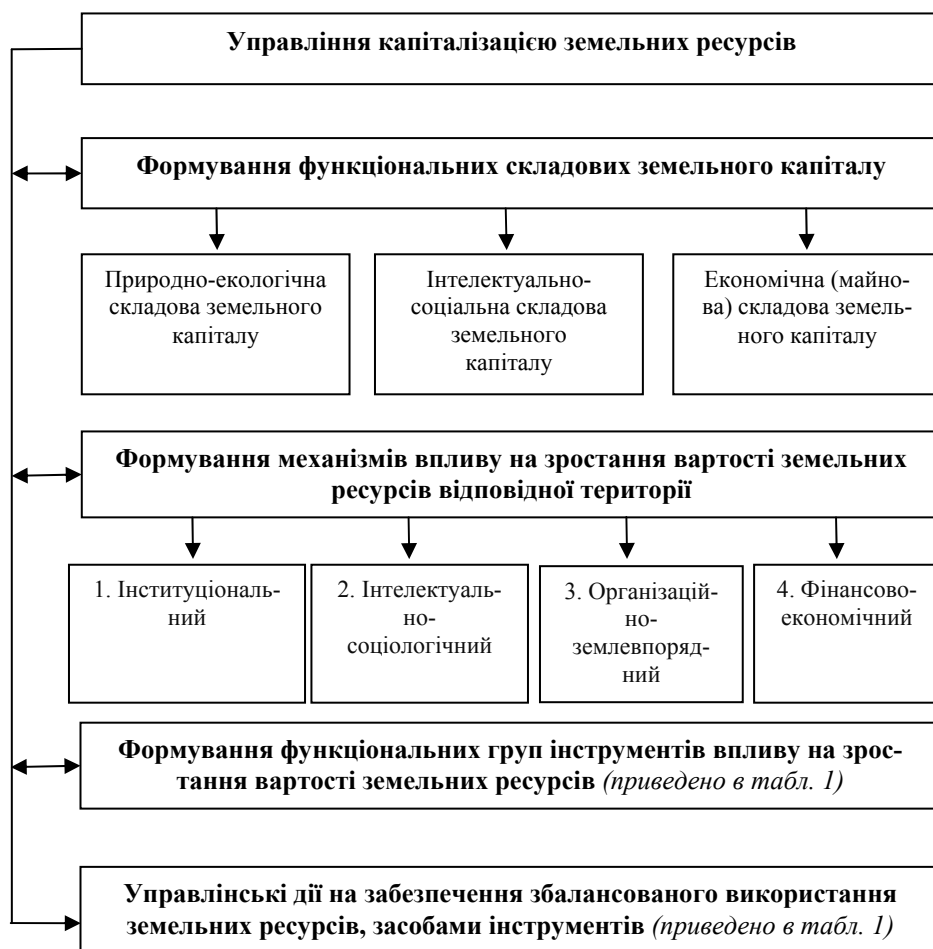
Рис. 3. Логіко-смысловая ієрархічна схема структури механізмів управління капіталізацією земельних ресурсів