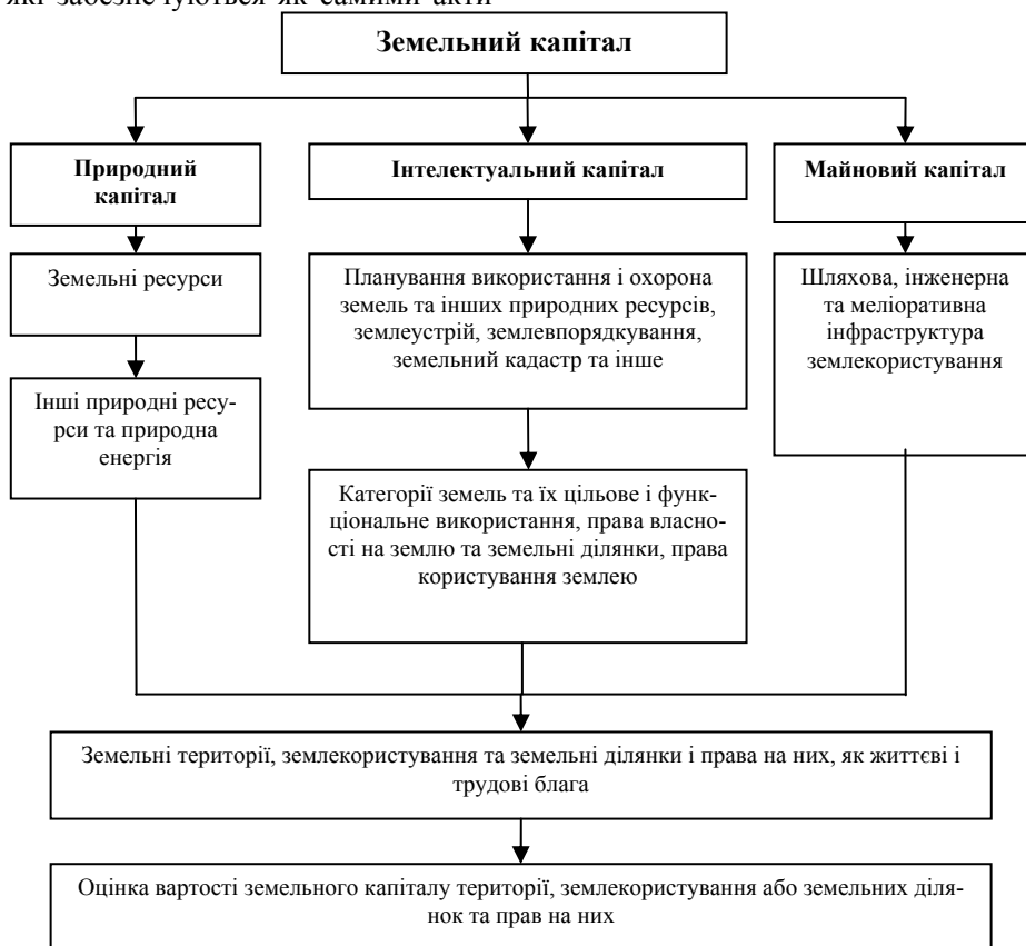
Рис. 1. Логічна модель структури методології формування земельного капіталу [6, с. 39]

вами, так і грошовими потоками, що ними генеруються. Сек'юритизація земельних ресурсів повинна включати в себе такі блоки: алокація ресурсу, в рамках якої відбувається специфікація прав власності на них та створення диверсифікованого пулу активів; створення компанії спеціального призначення SPV ( special purpose vehicle ), яка бере на себе управління відокремленим пулом активів; формування та відтворення капіталу шляхом рефінансування пулу активів на ринку капіталів або грошовому ринку за допомогою випуску цінних паперів.