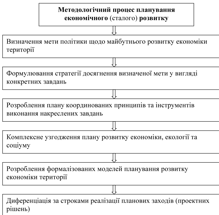
Рис. 2. Логічно-сміслова модель системи методології планування економічного (сталого) розвитку

Таким чином, система планування сталого розвитку включає процес, який характеризується набором цілеорієнтованих дій та інструментів щодо досягнення економічного розвитку (рис. 2).