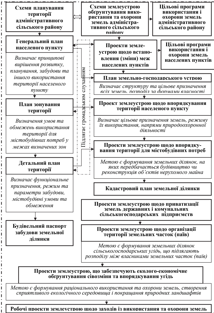
Рисунок 1. Логічно-смыслова модель містобудівного та землевпорядного проектування в системі територіального планування розвитку землекористування сільських територій