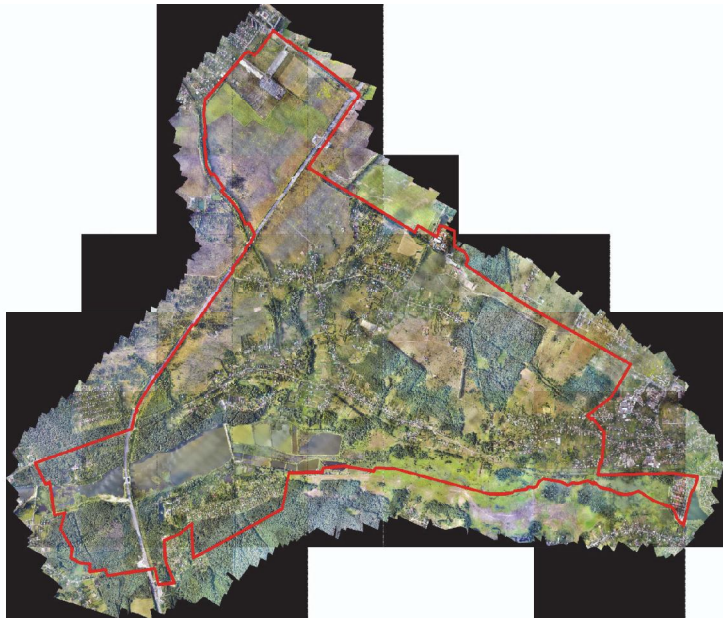
Рис.1. Ортофотоплан на територію с. Здорівка Васильківської міської територіальної громади

До просторових даних була віднесена інформація, що описує положення й форму географічних об'єктів і їх просторові зв'язки з іншими об'єктами, як населення населеного