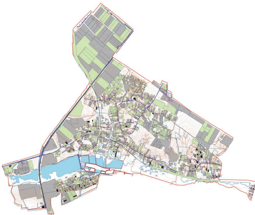
Рис.3. Схема забезпечення земельних ділянок даними з ДЗК та ДРПП с. Здорівка Васильківської міської територіальної громади.

Також варто звернути увагу, якщо протягом одного року з дня здійснення державної реєстрації земельної ділянки у ДЗК речове право на неї не буде зареєстровано з вини заявника, то держреєстрація земельної ділянки скасовується державним кадастровим реєстратором, який здійснює таку реєстрацію.